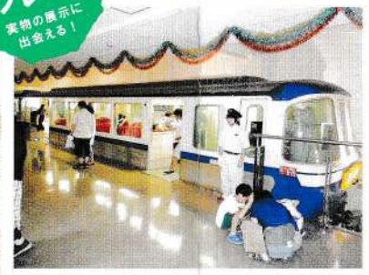
手柄山交流ステーション