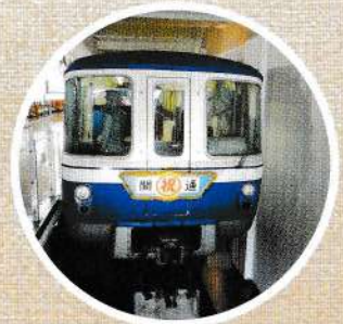
ロッキード社製 モノレール