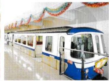
車庫に眠っていた車両が開業当時の姿に