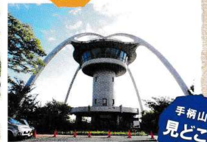
手柄山回転展望台 (閉鎖)