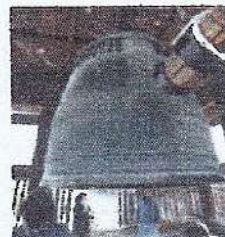
<京都方広寺の梵鐘>